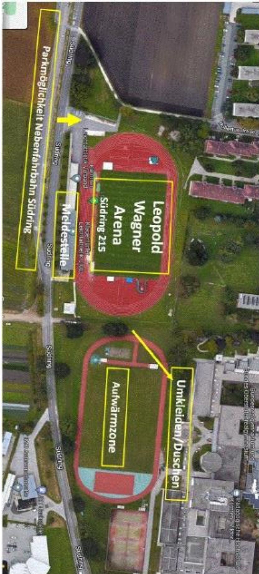
Übersichtsplan Leopold Wagner Arena